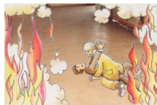
1.2 วิธีคนดับเพลิง