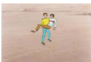
1.6 วิธีอุ้ม