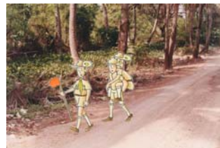
1.4 วิธีหิ้วหลัง