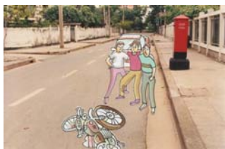
1.3 วิธีพยุง